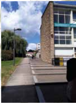
Mail piétonnier - Îlot des écoles